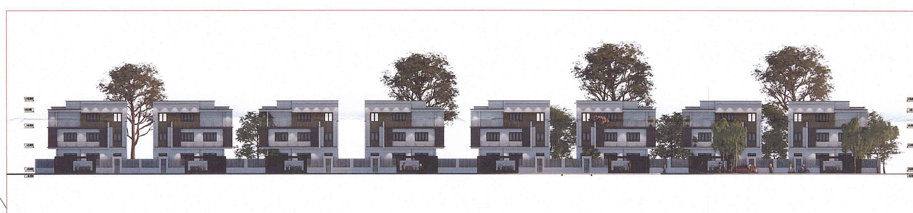
MẶT ĐỪNG KHÔNG GIẢN HƯỚNG NHÌN 2-2 (BIỆT THỰ BT-02)