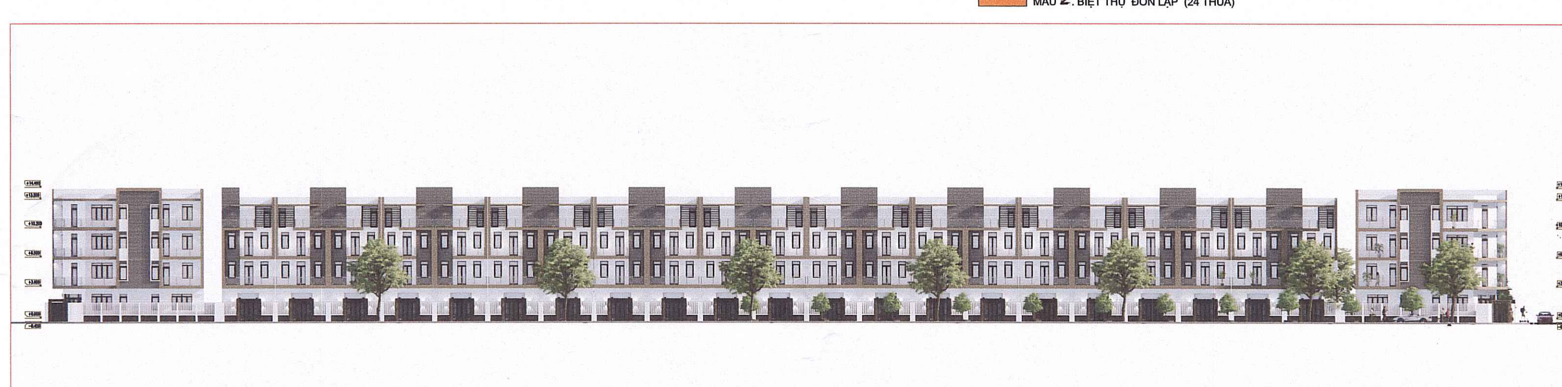
MẶT ĐỪNG KHÔNG GIẢN HƯỚNG NHÌN 1-1 ( LIỀN KỀ LK-14)