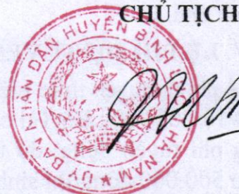
Trần Xuân Dũng